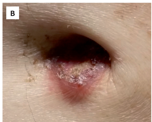
Figura 1. A) Paciente con distensión abdominal y hepatomegalia donde se aprecia lesión nodular en ombligo. B) A mayor aumento, nódulo umbilical de 2,5 cm de diámetro, de bordes mal definidos, eritematoso, centro ulcerado, no doloroso a la palpación.