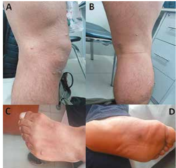
Figura 2: Lesiones dérmicas umbilicadas en A) Rodilla derecha B) Región poplíteea derecha C) Dorso del pie izquierdo D) Planta del pie izquierdo.