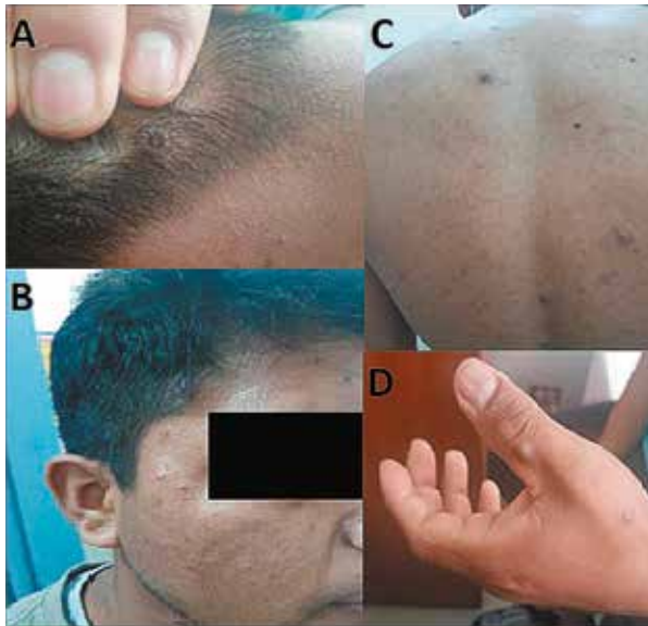
Figura 1: Lesiones dérmicas umbilicadas en A) Cuero cabelludo B) Región temporal C) Región posterior del tórax D) Dorso de la mano izquierda.