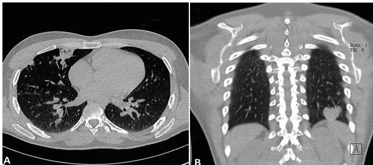
Figura 2. Tomografía de tórax sin contraste. Se observan múltiples micronódulos con engrosamiento intersticial en ambos pulmones, y focos de consolidación en lóbulo medio derecho (A) y lóbulo inferior izquierdo (B).

VIH, planteándose los criterios diagnósticos por el Centro para el Control y la Prevención de Enfermedades de Estados Unidos (Tabla 2).